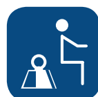
Max. gebr. gewicht ▼