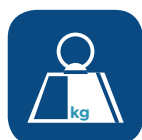
Totaal gewicht ▼