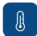
Max. reinigings-temperatuur ▼